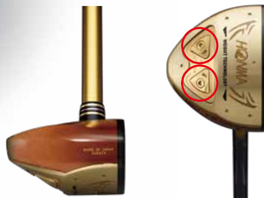
12gのタングステンウエイトを2個装着

高反発フェース カーボン+PBO繊維「ザイロン®」採用で、 大きな飛距離を実現。